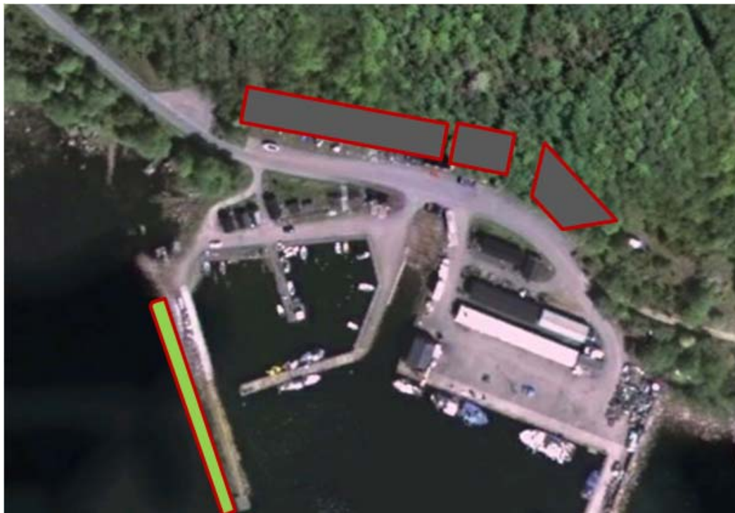
Bild2. Hallar, spolplatta, båtplatser skissade av J-A Månsson.